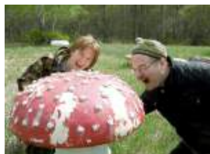
(Продолжение. Начало на стр.1)