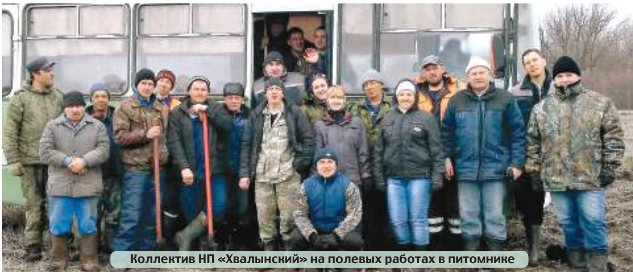
Коллектив НП «Хвалынский» на полевых работах в питомнике