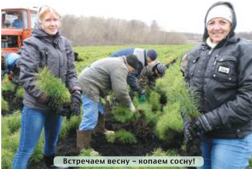
Встречаем весну – копаем сосну!