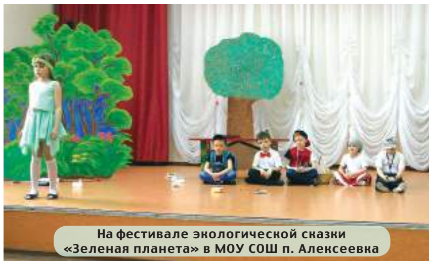
На фестивале экологической сказки «Зеленая планета» в МОУ СОШ п. Алексеевка

18 июня был проведен праздник «Славься, березовая Русь!» в березовой роще НП «Хвалынский».