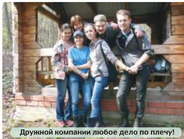
Дружной компании любое дело по плечу!