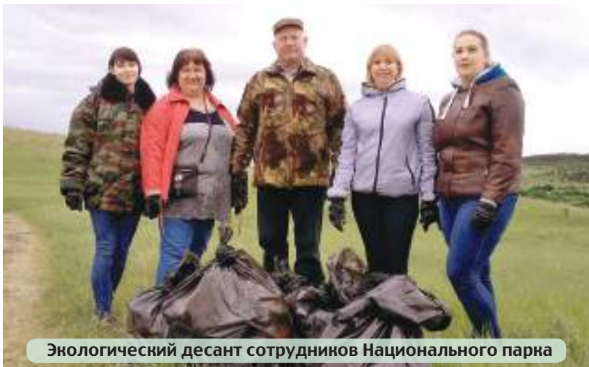
Экологический десант сотрудников Национального парка