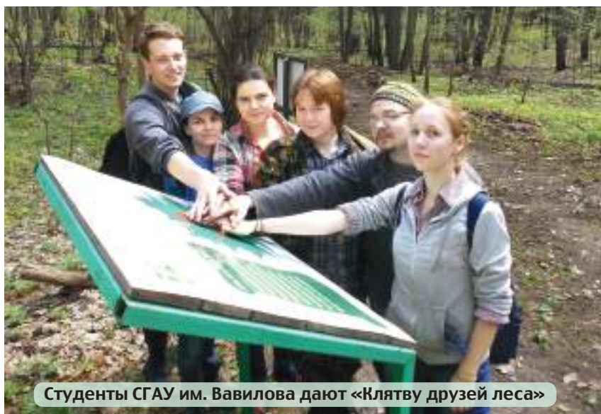
Студенты СГАУ им. Вавилова дают «Клятву друзьям леса»

Не секрет, что в богатствах природы человек привык видеть «скатерть-самобранку», считая, что ее богатства не оскудевают. И в итоге медленно, но верно он сползает в собственноручно вырытые ямы экологических катастроф. В значительной степени это относится и к лесным ресурсам, которые зачастую варварски уничтожаются ради сиюминутной наживы. Решить проблему баланса потребления и восстановления леса смогут лишь люди, любящие природу не на словах, а на деле.